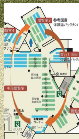
新着雑誌コーナー

替わって、閲覧室3に移設された「参考図書」は、書架が低くなって、明るい空間になりました。