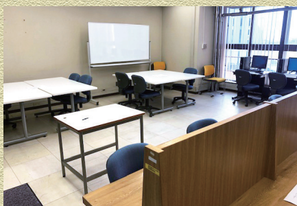
ラーニングコモンズの様子

入口向かい側のオープンターミナル室をリニューアルし、グループ学習向けの学習室「ラーニングコモンズ」としてオープンしました! 学習用パソコン4台も、変わらず利用していただけます。