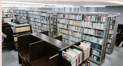
閲覧室2 料理・旅行・小説など

図書館には専門書以外の本もたくさんあります。入館ゲートを通って、右手の方にある閲覧室1,2には、「本に親しむ」コーナーにあった図書をはじめ、旅行や料理の本、話題となった小説などがあります。