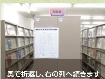
奥で折返し、右の列へ続きます