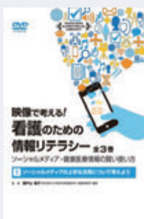
「映像で考える! 看護のための情報リテラシー」 /丸善雄松堂/(WY26.5/Eiz)

レポートの書き方や医療英語、医療技術などの勉強に役立つ視聴覚資料(VHS・DVD)はもちろん、娯楽の映画やドラマもおいてあります。貸出できない資料もありますが、視聴ブースも完備しているのでご安心ください。