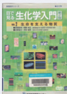
「目で見る生化学入門」 /医学映像教育センター /(QU4/Med)